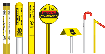
De izquierda a derecha: Marcador TriView™, Marcador Domo, Marcador Plano, Marcador Redondo, Marcador Aéreo, Marcadores de Tubos de Ventilación.

Aunque no siempre están presentes en ciertas áreas, estos marcadores se pueden encontrar en los cruces de ferrocarriles, las cercas y en las intersecciones de calles. Los marcadores muestran el producto que es transportado en la línea, el nombre del operador de la línea de tuberías y un número de teléfono donde puede contactar al operador en el caso de una emergencia.