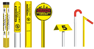
From left to right: TriView™ Marker, Dome Marker, Flat Marker, Round Marker, Aerial Marker, Casing Vent Markers.

Although not present in certain areas, these can be found at road crossings, fence lines, and street intersections. The markers display the product transported in the line, the name of the pipeline operator, and a telephone number where the operator can be reached in the event of an emergency.